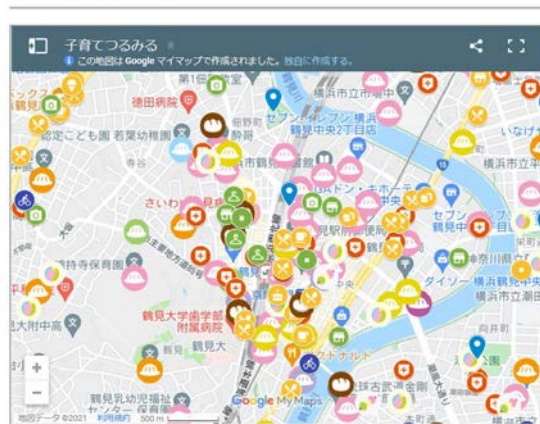
つるみままっぷ WEB版

横浜市鶴見区の子育て情報サイト「こそだてつるみる」につるみままっぷ裏面に掲載している情報をアップ。